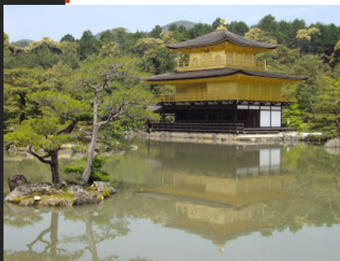
Kioto Autor: Selene

Kioto, Es conocida como el corazón de Japón