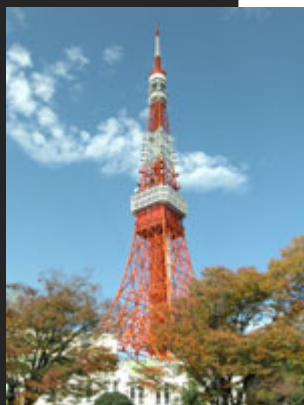
Torre de Tokio