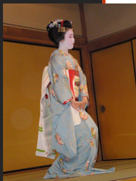
Geisha Autor: Xansolo

Kioto, Es conocida como el corazón de Japón